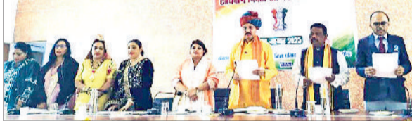
सिरसा। संविधान की शपथ लेते हुए।