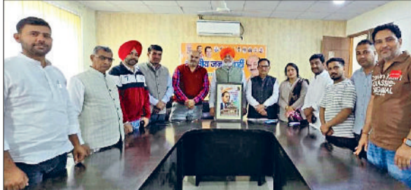
फतेहाबाद। संगोष्ठी में भाग लेते भाजपा नेता।

नगरिकों को सामाजिक, आर्थिक और राजनीतिक न्याय, विचार, अभिव्यक्ति, विश्वास, धर्म और उपासना की स्वतंत्रता, प्रतिष्ठा व समता का अवसर प्रदान करता है। भारतीय संविधान समता, न्याय व