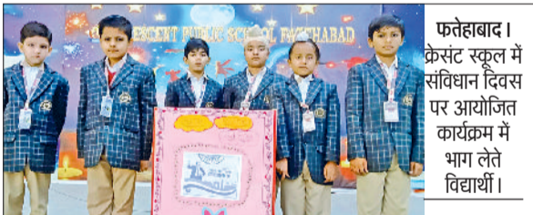
फतेहाबाद। क्रेसंट स्कूल में संविधान दिवस पर आयोजित कार्यक्रम में भाग लेते विद्यार्थी।