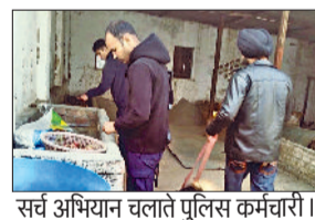
सर्व अभियान चलाते पुलिस कर्मचारी।