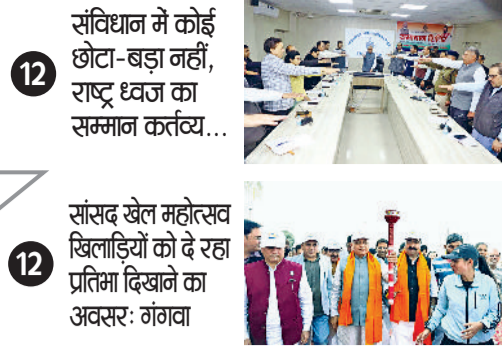
12 संविधान में कोई छोटा-बड़ा नहीं, राष्ट्र ध्वज का सम्मान कर्तव्य... 12 सांसद खेल महोत्सव खिलाड़ियों को दे रहा प्रतिभा दिखाने का अवसर: गंगवा